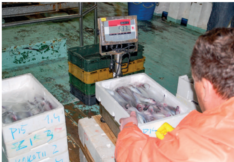
Slika 3. Izvagani i označeni proizvodi

Za ulove namijenjene prvoj prodaji poznatom prvom kupcu izvan teritorija Republike Hrvatske vaganje je obvezno na iskrcajnom mjestu , a inozemni prvi kupac obavezan je na PGR-u podnijeti Zahtjev za odobrenje vaganja na iskrcajnom mjestu, dok iznimno, u slučaju kada inozemni prvi kupac nije poznat i nije moguće vaganje obavljati na plovilu, ribar treba obaviti vaganje te podatke unijeti u transportni dokument na PGR-u.