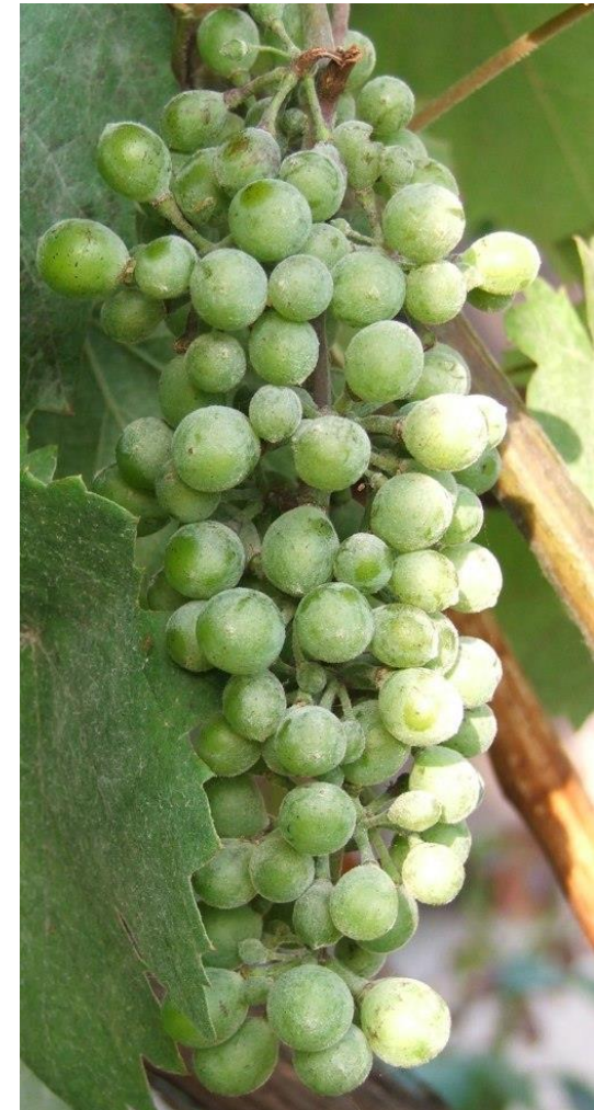
Slika 1: grozd zaražen pepelnicom