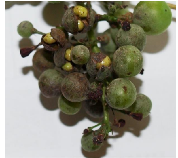
Slika 2: pucanje bobica zaraženih pepelnicom