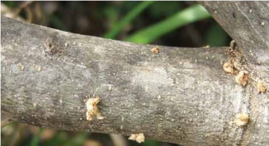
Maslinin smeđi potkornjak