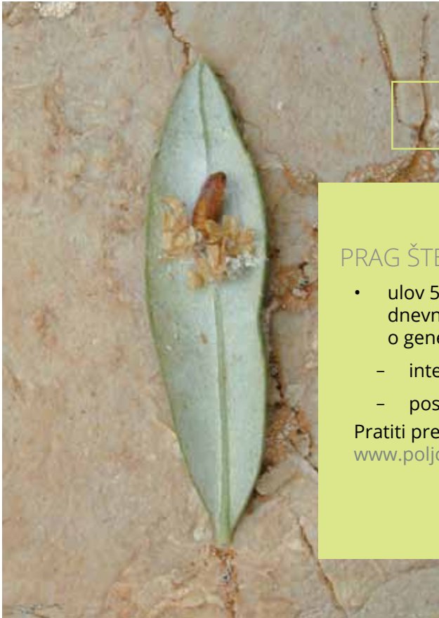
Kukuljica - maslinin moljac