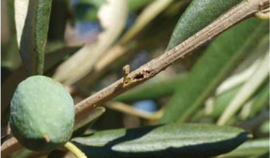
Hodnici u grančici masline