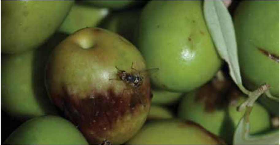
Maslinina muha - imago