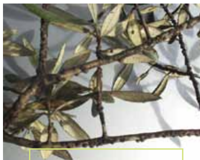
Maslinin medić - gljive čađavice