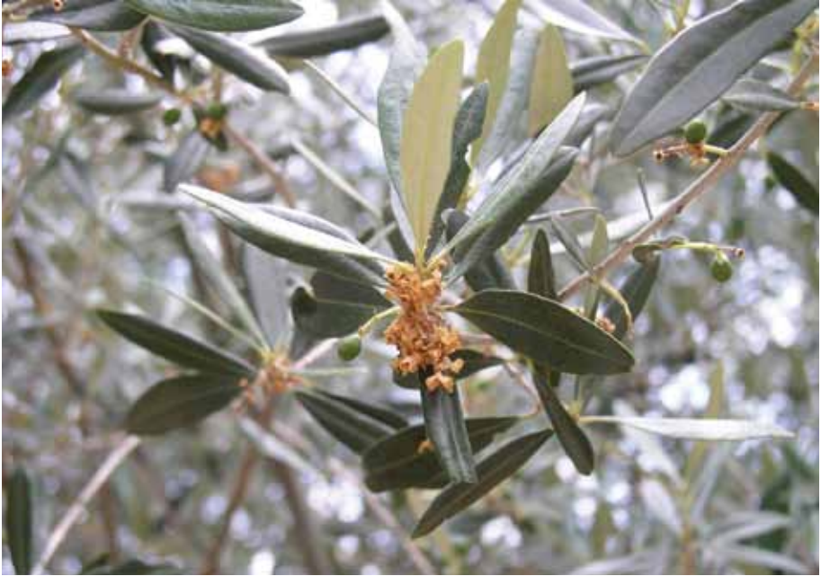
Maslinin moljac - štete od antofagne generacije