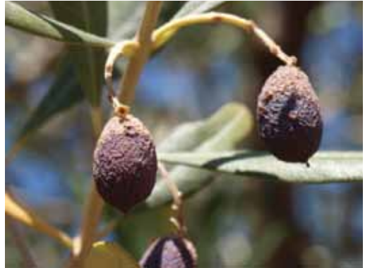
Sušenje plodića, posljedica ranijeg napada maslinina svrdlaša - vidljivo mjesto uboda