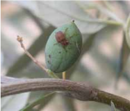
Odrasli oblik maslininog svrdlaša