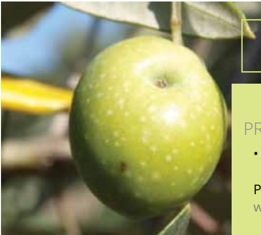
Razlika u ubodu maslininog svrdlaša (širok okrugli ubod) i maslinine muhe (klinasti ubod)