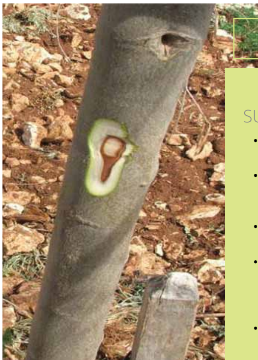
Napad potkornjaka na maslini stradaloj od niskih temperatura