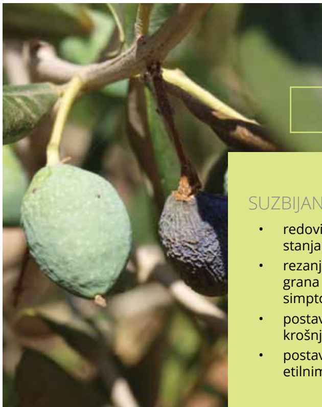
Sušenje peteljčice ploda