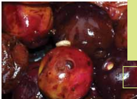
Maslinina muha - ličinka; razvoj platule ploda

Pratiti preporuke za zaštitu bilja www.poljoprivreda.gov.hr