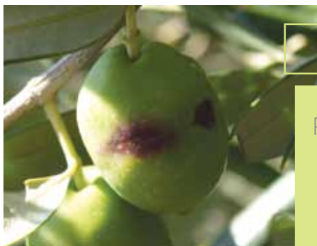
Simptomi napada na plodu, vidljiv i izlazni okrugli otvor desno